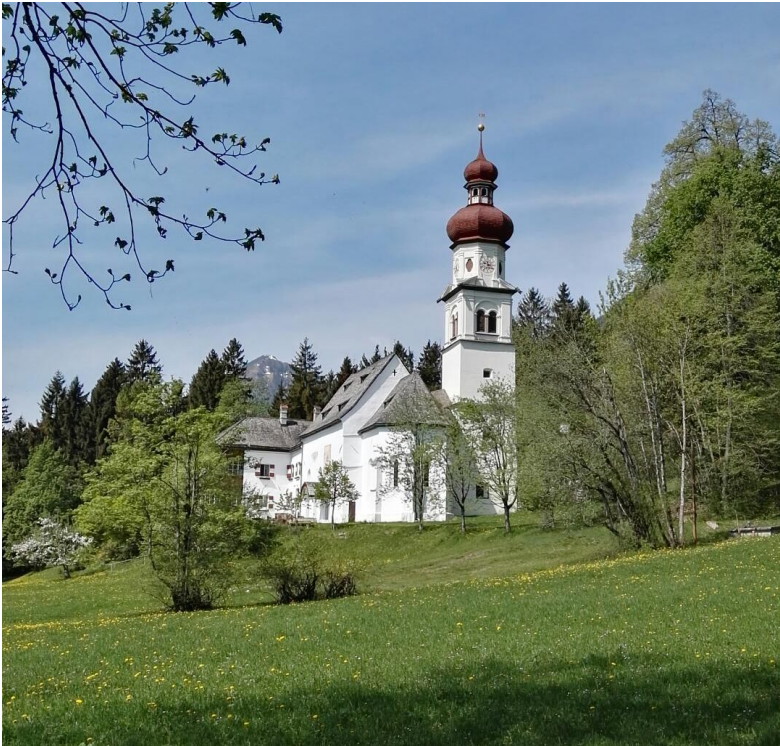
St. Martin, Gnadenwald/Absam in Tirol